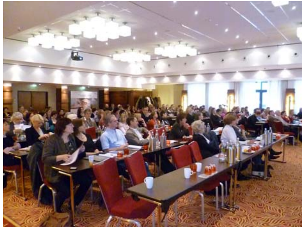
Abbildung 2 Teilnehmer der PSO-Jahrestagung

Um diese wichtigen Aspekte der modernen Psychoonkologie zu diskutieren, kamen am ersten Dezemberwochenende über 150 Interessierte nach Köln. Das Programm rekrutierte sich aus eingesandten Beiträgen und aus eingeladenen Vorträgen aus dem Förderschwerpunktprogramm „Psychosoziale Onkologie“ der DKH. Auch in diesem Jahr wurde jeder Themenblock durch ein Impuls- oder Übersichtsreferat eingeleitet. Damit folgte die Tagung den erfolgreichen Konzepten der Vorjahre. Neu war eine fachübergreifende Key Note Lecture.